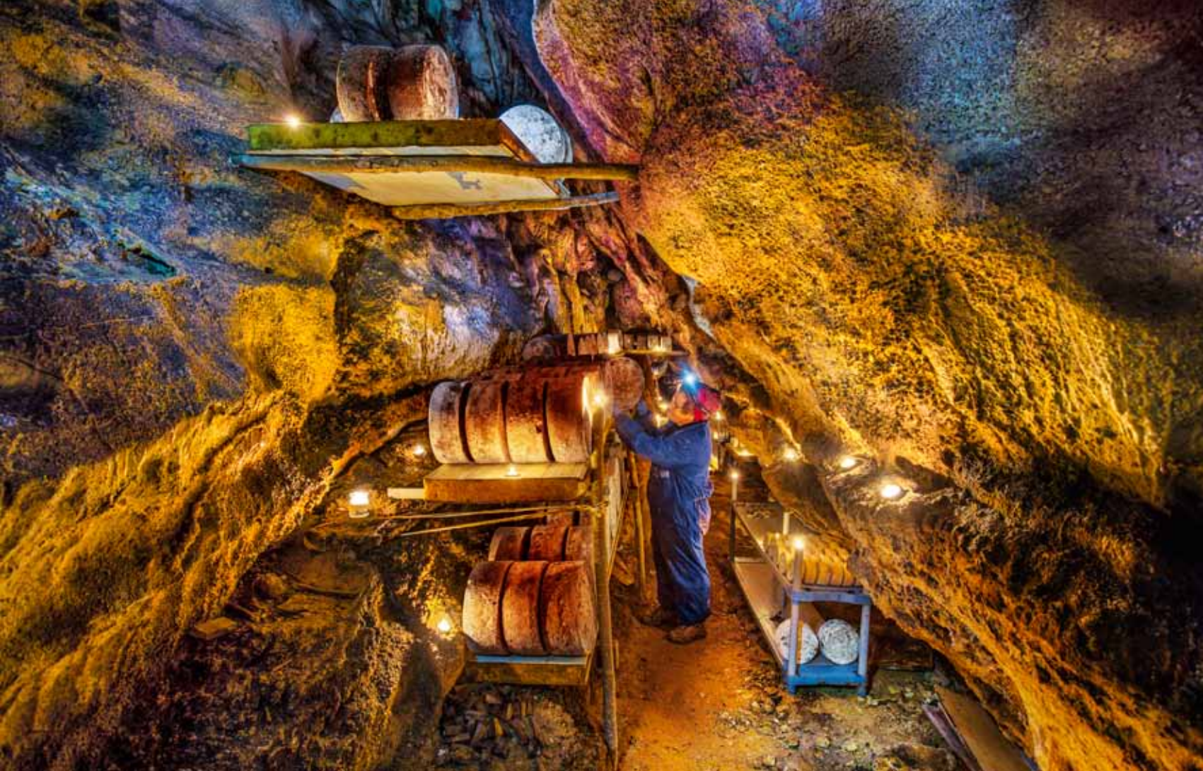
Elaboración y fermentación del queso Gamonéu en las entrañas de los Picos de Europa. En la página anterior, la forja de Mazonovo, en la comarca de Oscos-Eo, Reserva de la Biosfera, y una imagen exclusiva para VIAJAR de "La Santina", la Virgen de Covadonga que se venera en el Santuario de la gruta del monte Auseva. La patrona de Asturias aparece aquí sin manto ni corona.