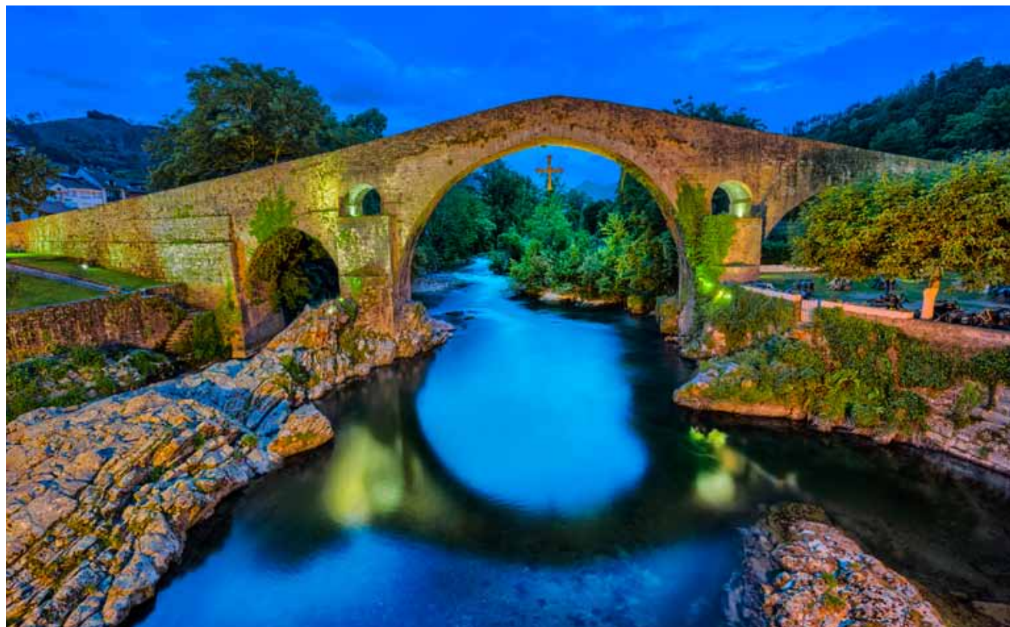
El puente romano de Cangas de Onís sobre el río Sella, de cuyo arco central cuelga la Cruz de la Victoria. Derecha, la Basílica de Santa María la Real de Covadonga, de estilo neorrománico y construida íntegramente en piedra caliza rosa. En este enclave se fraguó, a principios del siglo VIII, el origen del Reino Astur y de la Reconquista comandada por Don Pelayo.