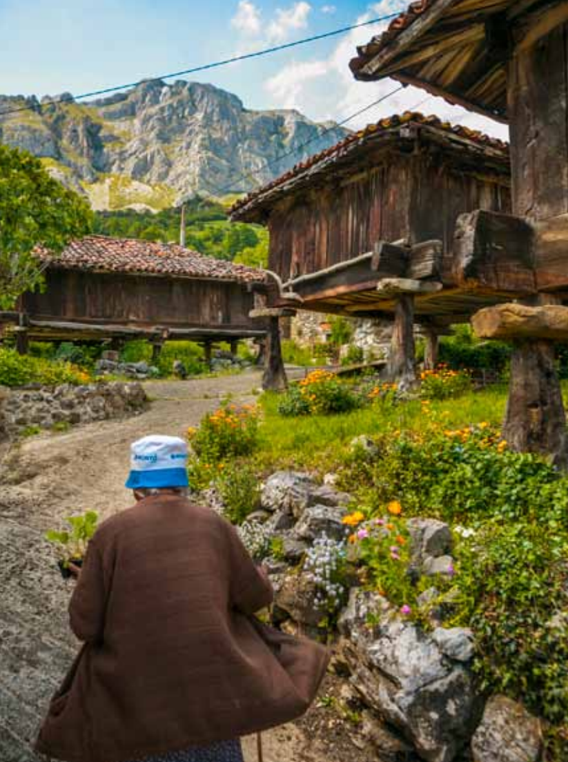
Los hórreos del concejo de Quirós datan del siglo XVI y albergan misteriosas obras de estarcido, con grabados y símbolos solares en liños, colondras, puertas y esquinas. En la página siguiente, imagen de un arroyo en un bosque de los Picos de Europa en el Concejo de Cangas de Onís.

vetusto documento. Ya en el claustro gótico se sienten las misteriosas potencias celestiales como protección de las puertas del cielo. Entre los muros de la Basílica, aún sin ser hallada, se dice que se guarda la legendaria casulla del obispo toledano San Ildefonso, impuesta al santo por la Virgen. Y presidiendo secretos y certezas, la imagen románica del Salvador que sostiene en sus manos el enigmático orbe isidoriano. También en Oviedo están los frescos de la iglesia prerrománica más grande de España y probablemente del mundo, la de San Julián de los Prados (S IX), que exhibe desde sus muros la pervivencia de Roma en Asturias. Son los únicos de su época que muestran la imagen de lo que habría de ser la decoración de un palacio romano. Sus cortinajes, edículos e iglesias coloreados en ocre, rojo y un peculiar negro-azulado obtenidos de pigmentos minerales forman parte de un decorado ilusionista. Todo símbolos, ningún personaje. En lo alto de sus paredes, interpretadas como arcos de triunfo, la Cruz anicónica de San Juan, con el alfa y el omega y dos iglesias representando a las ciudades de Belén y Jerusalén. Una exclusividad artística que es también Patrimonio de la Humanidad, como la gran parte del Prerrománico asturiano.