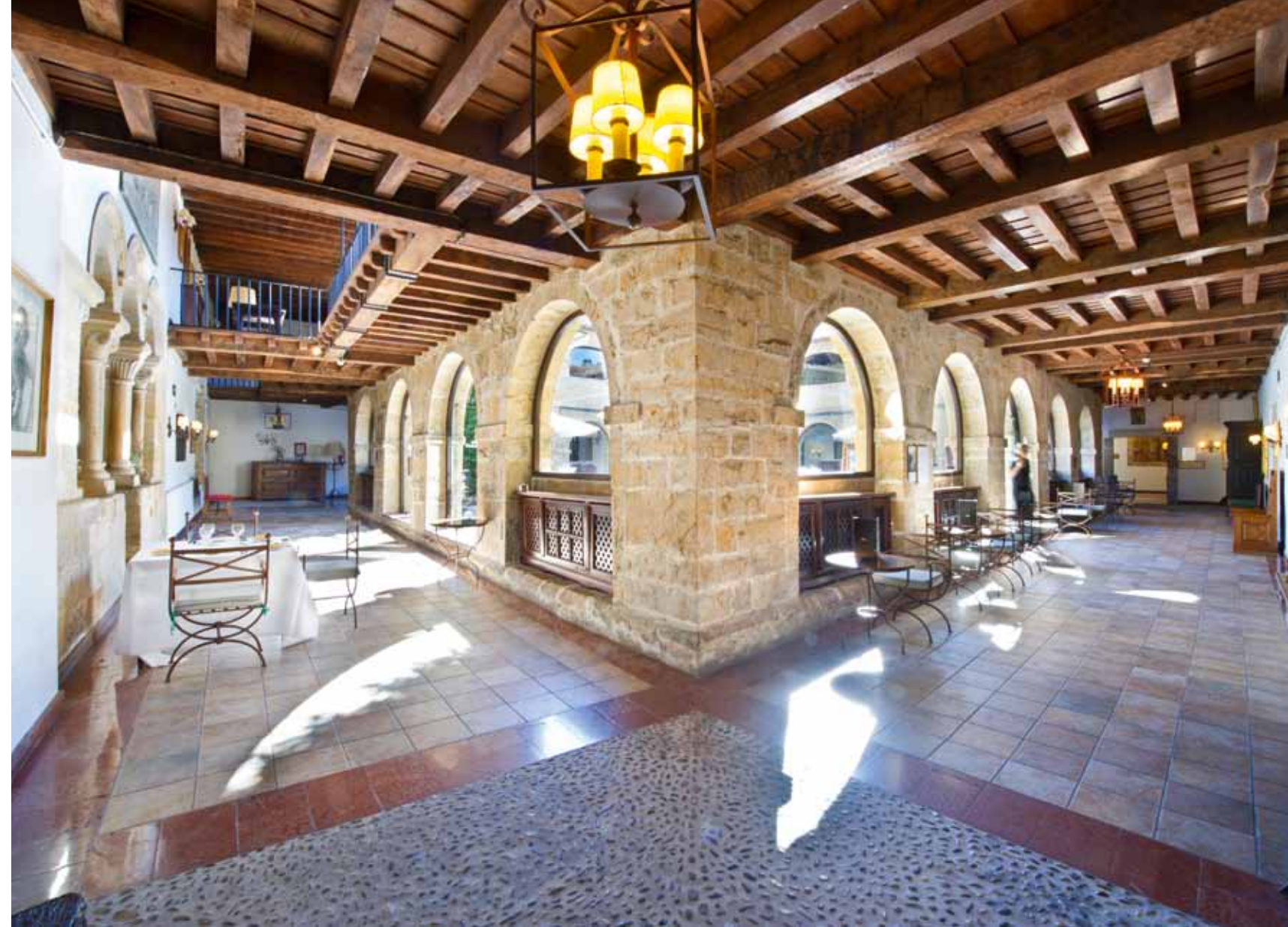
Las estancias de piedra y madera del interior del Parador están decoradas de forma elegante, cálida y tradicional. Ubicado a dos kilómetros de Cangas de Onís, el Parador es un punto de partida ideal para visitar el Parque Natural de Los Picos de Europa, el Santuario y los lagos de Covadonga y pueblos costeros como Llanes y Ribadesella.

La Red de Paradores cuenta en la actualidad con 95 establecimientos y está prevista la apertura de dos nuevos Paradores de Turismo en el Monasterio de Veruela, en la comarca aragonesa de Tarazona, y en el antiguo convento de Roser, en el centro histórico de Lleida ( parador.es ).